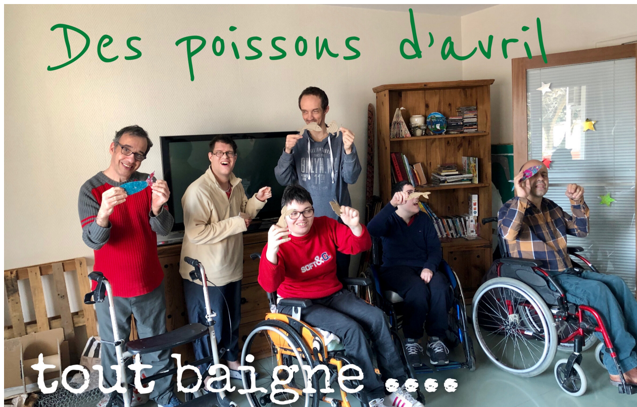
Les résidents de Villepatour étaient fin prêts pour fêter le 1er avril