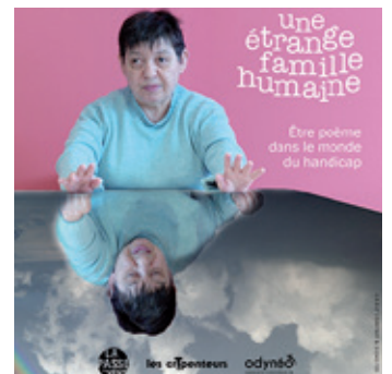
LE LIVRE "ÊTRE POÈME DANS LE MONDE DU HANDICAP" P. 14