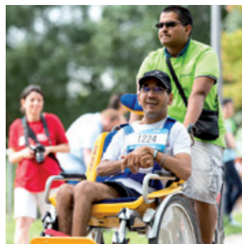
LA COURSE DES HÉROS 2021 P. 13