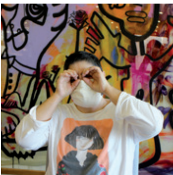
BIENVENUE AU PÔLE HANDICAP MENTAL ! P. 8/9